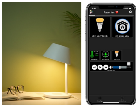
Datei: 03-Yeelight in der iHaus Smart Living App

Yeelight Leuchten werden zu Signalgebern. Vernetzt mit dem iHaus Rauchmelder können sie bei Rauchentwicklung beispielsweise rot blinken.