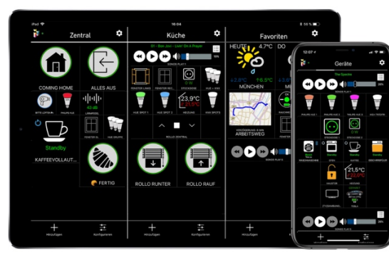
Datei: 04-iHaus Smart Living App Interface

Nahtlose Integration: Yeelight Produkte können in der iHaus App mit anderen Smart-Living-Produkten verbunden, zentral gesteuert und automatisiert werden.