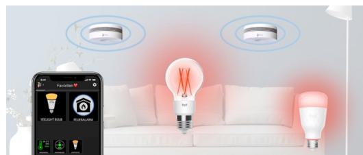
Datei: 02-Smarte Szenen mit iHaus und Yeelight

Licht kann mehr als leuchten: Yeelight wird neuer iHaus Smart-Living-Plattform-Partner.