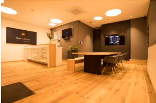
Datei: 01_ Computerhaus-GDD-SalesPoint

In dem Referenzprojekt Computerhaus GDD SalesPoint ist die iHaus Plattform mitunter dem LITECOM DALI Lichtsystem von Zumtobel, dem KNX-Bussystem und IoT Anwendungen im Einsatz.